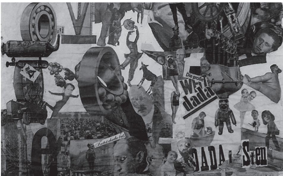
AVVISO AI NAVIGANTI: questo foglio si prende una pausa estiva. Ci rivediamo dopo l'estate con un numero speciale su un tema che ci sta a cuore

Avvertenza per chi legge: se non meglio specificato dove il genere è utilizzato al maschile è da intendersi anche al femminile. La lingua italiana conserva anche nella sua grammatica la dominanza del maschile sul femminile che ritroviamo nell'intera società.