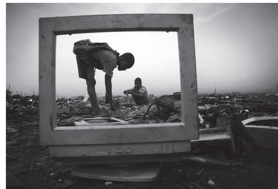
Avvertenza per chi legge: se non meglio specificato dove il genere è utilizzato al maschile è da intendersi anche al femminile. La lingua italiana conserva anche nella sua grammatica la dominanza del maschile sul femminile che ritroviamo nell'intera società.

"Sotto il luccichio che esibisce si nasconde un mondo di desolazione" Emil Cioran