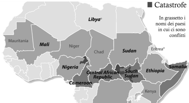
CARESTIE E CONFLITTI IN AFRICA (Feb. 2017)

Facendosi suggestionare da alcune perturbazioni provenienti dal Belgio e da Monaco, ritroviamo quindi attorno a noi la responsabilità dei massacri ecologici e sociali su cui ci illudiamo di non poter intervenire.